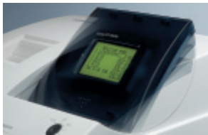
Das LCD-Display, schwenkbar