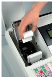
D & P (Drop and Print)