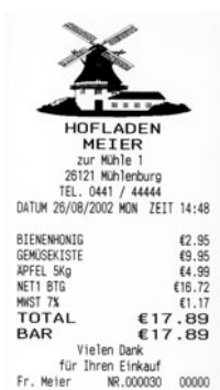
Bon-Muster (stark verkleinert)